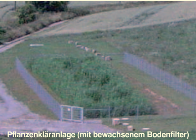
Pflanzenkläranlage (mit bewachsenem Bodenfilter)