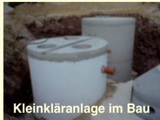
Kleinkläranlage im Bau

Die Baukosten umfassen im Wesentlichen den Einbau der Kleinkläranlagen bzw. das Verlegen der Rohrleitungen. Sie unterliegen starken regionalen Schwankungen und sind zudem von den örtlichen Verhältnissen abhängig.