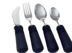
Besteck mit Griffverdickung